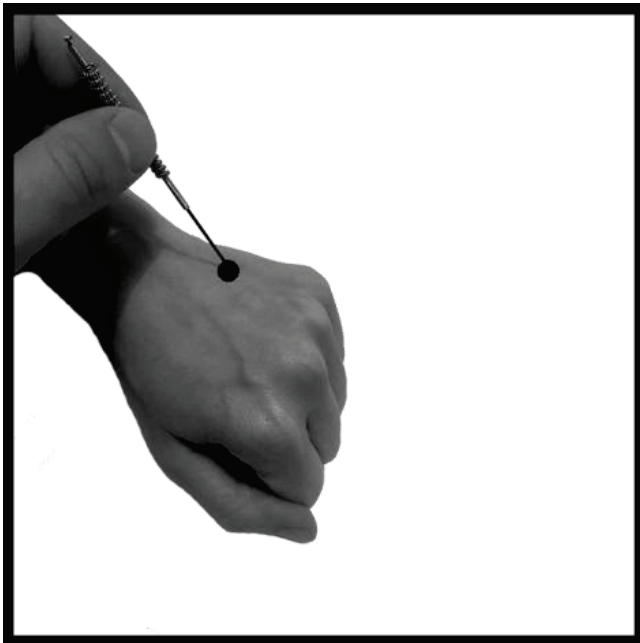
Φωτογραφία 9. 22.7 Κάτω Λευκό (Xià Bái, 下白).