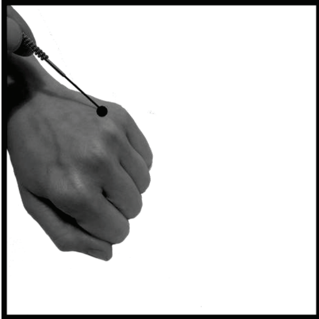
Φωτογραφία 8. Σημείο 22.6 Μέσο Λευκό ( Zhōng Bái , 中白).